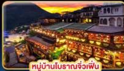
หมู่บ้านโบราณจื่อเฟิน