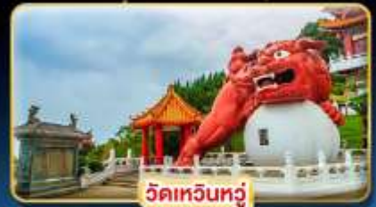
วัดเหวินทง