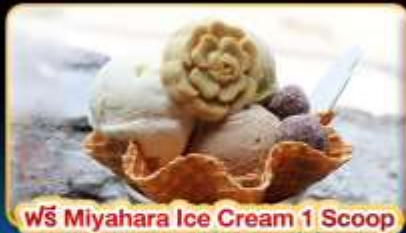
ฟรี Miyahara Ice Cream 1 Scoop

"ขอความรักวัดหลงซาน" ปล่อยคอมลอยเส้นทางรถไฟผิงซี