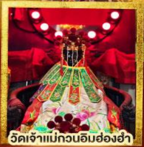
วัดเจ้าแม่กวนอิมฮ่องฮ่า