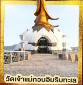
วัดเจ้าแม่กวนอิมริมทะเล