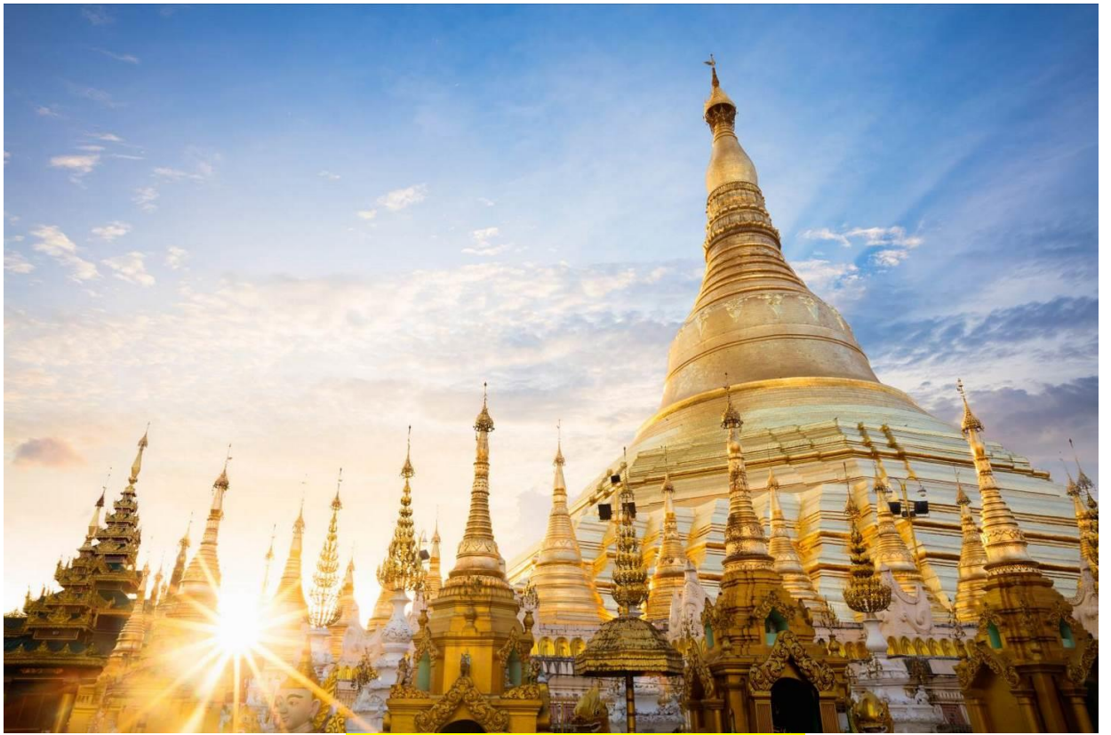
บทสวดมนต์บูชาพระมหาเจดีย์ชเวดากอง

วันทามิ อุตตมะ ชมพู วรรณานะ สิงกุตตะเร มะโนลัมเม สัตตัง สะรัตนะ ปฐมัง กกุสันธัง สุวรรณะ ตันตัง ธาตุโย ธัสสะติ ทุตติยัง โภนาคะมะนัง ธัมมะ การะนัง ธาตุโย ธัสสะติ ตติยัง กัสสปัง พุทธจีวะรัง ธาตุโย ธัสสะติ จตุกัง โคตะมัง อิตถะเกศา ธาตุโย ธัสสะติ อหัง วันทามิ ตุระโต อหัง วันทามิ ธาตุโย อหัง วันทามิ สัพพะทา อหัง วันทามิ สิริสะธา