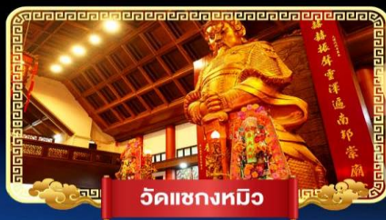
วัดเข่งหมิว