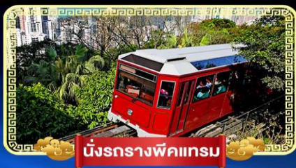
นั่งรถรางพิกแตรม

นั่งกระเช้ามองปิง 360 องศา บินลัดฟ้าไปมู..สู่เกาะฮ่องกง