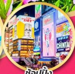
ช้อปปิ้ง ชินไซบาชิ

เที่ยวเต็มทุกวัน ไม่มีฟรีเดย์ บินเข้านาโงย่า-ออกโอซาก้า