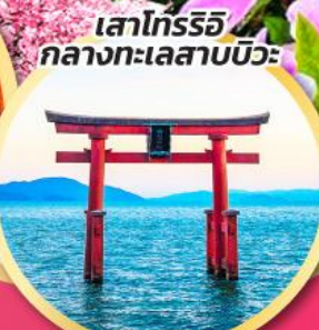
เสาโทริอิ กลางทะเลสาบบิวะ