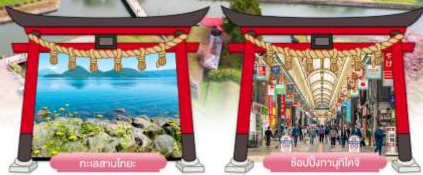
ทะเลสาบโทยะ