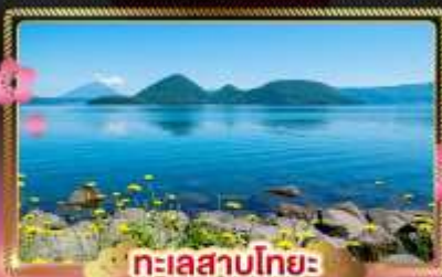
ทะเลสาบโทโยะ