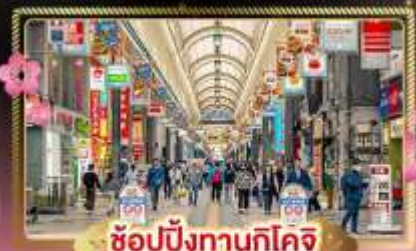
ช้อปปิ้งทานุกิโคจิ