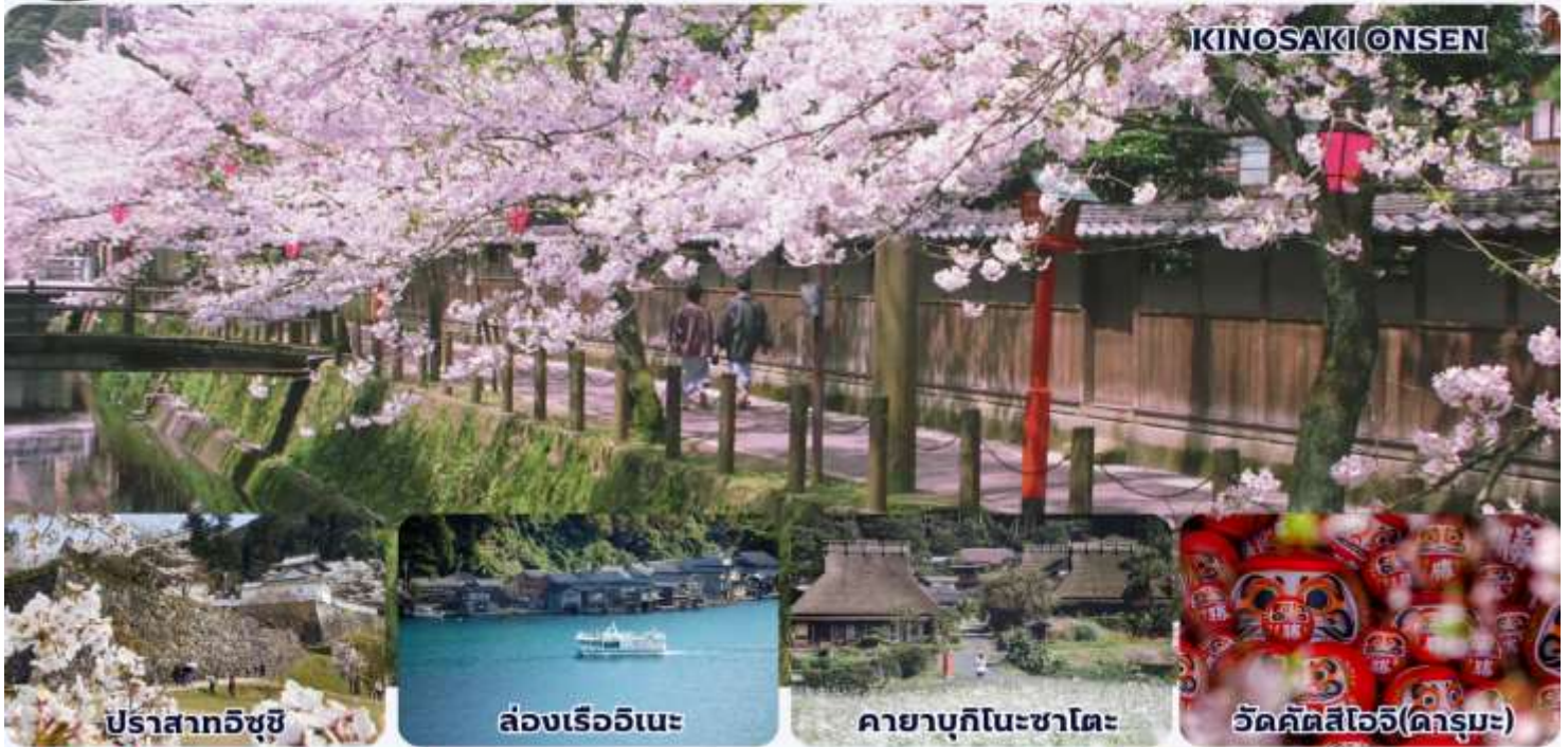
ปราสาทอิซุชิ

เกียวโต(อิซุชิ,คิโนะซากิ)-เกียวโต(อีนะ,มียะจิ)-โอซาก้า