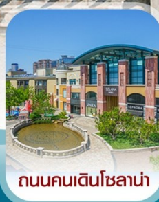
ถนนคนเดินโซลาหน้า

คอนเฟิร์มออกเดินทาง ทุกพีเรียด 2 ท่านขึ้นไป