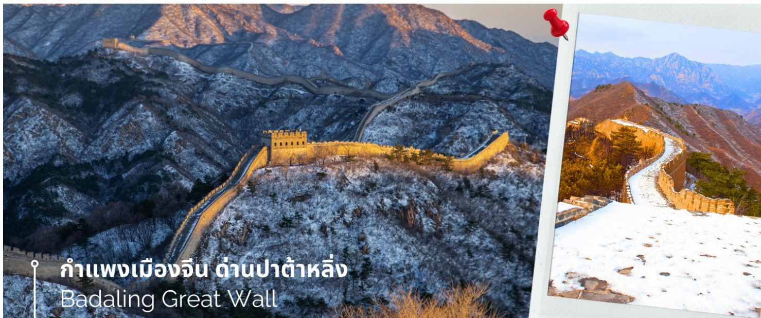
กำแพงเมืองจีน ด้านปาต้าหลิ่ง Badaling Great Wall

จากนั้นนำท่านเดินทางชมความยิ่งใหญ่ของ กำแพงเมืองจีน ด้านปาต้าหลิ่ง เป็นที่ตั้งของกำแพงเมืองจีนที่มีผู้เข้าชมมากที่สุด ห่างจากใจกลางเมืองปักกิ่งไปทางตะวันตกเฉียงเหนือประมาณ 80 กิโลเมตร ในเมืองปาต้าหลิ่ง เขตหยานชิง เทศบาลนครปักกิ่ง ได้รับการอนุรักษ์อย่างดีที่สุดของกำแพงเมืองจีน นำท่านนั่งกระเช้าลอยฟ้า (รวมค่ากระเช้า) เพื่อขึ้นไปยังจุดชมวิวของด้านปาต้าหลิ่ง ด้วยความสะดวกสบาย ให้ท่านได้มีเวลาถ่ายรูปเก็บบรรยากาศ ความสวยงามและ