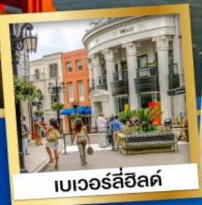
เบเวอร์ลี่ฮิลล์