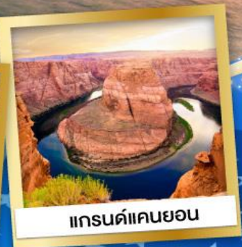
แกรนด์แคนยอน