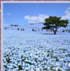
"HITACHI SEASIDE PARK"