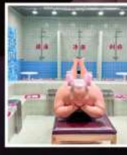
คาเฟ่ย้อนยุคเหอผิง