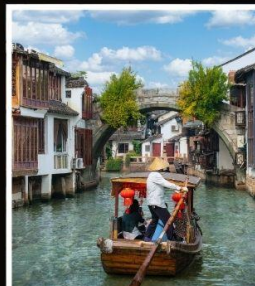
เมืองโบราณ จูเจียเจี้ยว