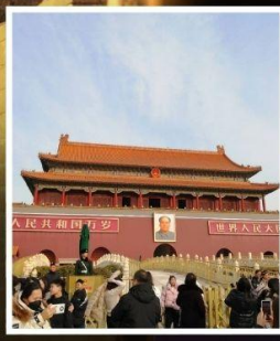
จัตุรัส เทียนอันเหมิน