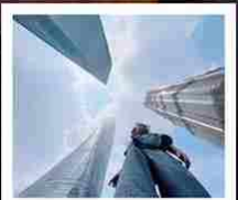
เซ็กเมน 3 ตึกใหญ่แห่งเซี่ยงไฮ้