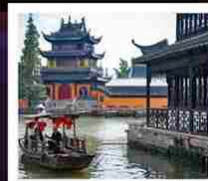
เมืองโบราณจูจียจี้ว

ท่าอากาศยานนานาชาติปักกิ่ง / ซาน หลีถุน / SOLANA CENTER จัตุรัสเทียนอันเหมิน / พระราชวังโบราณกู้กง / หอบูชาเทียนถาน ถนนโบราณหนานหลิวกู่เซียง / ถนนหวังฟู่จิง / คาเฟ่ย้อนยุคเหอผิง North Bund Green Land / คลาสสิก ไนท์ (Shanghai Classic Night) เมืองโบราณจูจียจี้ว + ล่องเรือ / Tianan 1000 tree / ย่านซินเทียนตี้ ขึ้นหอไข่มุก / 3 ตึกใหญ่แห่งเซี่ยงไฮ้ / ถนนอันฟู่ / ถนนหวยไห่