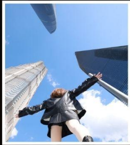
เช็กเมนู 3 ตึกใหญ่ แห่งเซี่ยงไฮ้