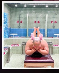
คาเฟ่ย้อนยุคเหอผิง