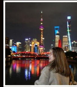
SHANGHAI (CLASSIC NIGHT)