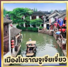
เมืองโบราณจูเจียเจียว