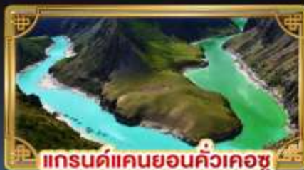
แกรนด์แคนยอนคิ้วเคอซู