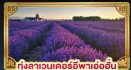
ทุ่งลาเวนเดอร์อิฟาเอ้อฮิน