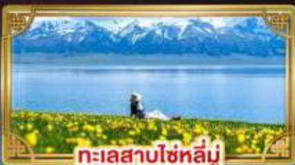
ทะเลสาบไซหลี่มู่