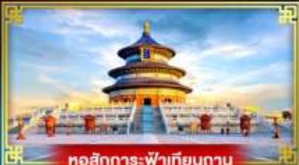
หอสักการะฟ้าเทียนถาน