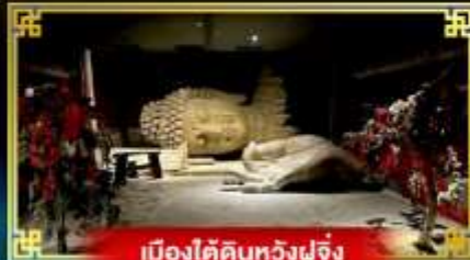
เมืองใต้ดินหวงฝูจิ่ง