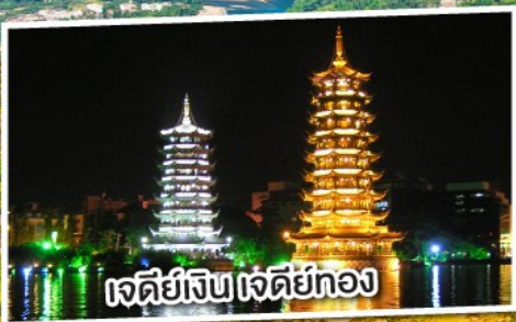
เจดีย์สิบเจดีย์ทอง