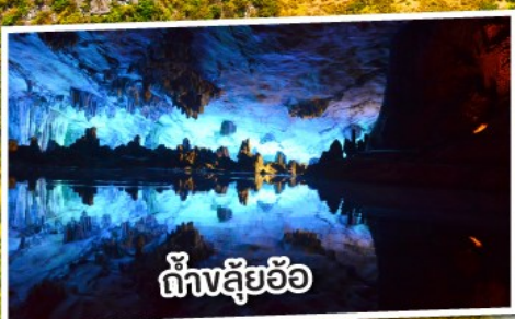
ถ้ำสุยอ้อ