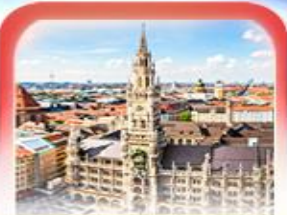
จัตุรัสมาเรียนพลักซ์