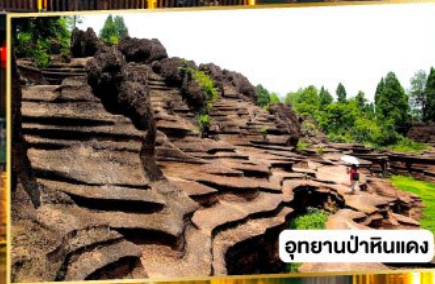
อุทยานป่าหินแดง