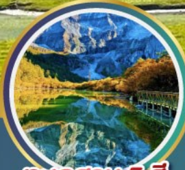
ทะเลสาบ 5 สี