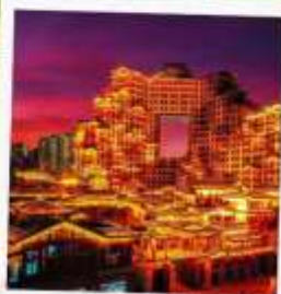
ตึก 72 ชั้น