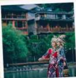
ชุดพื้นเมืองฟ่งหวง