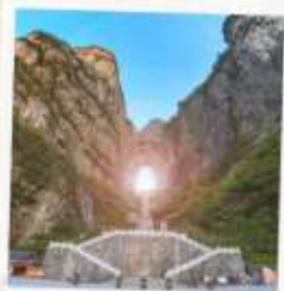
เทียนเหมินซาน