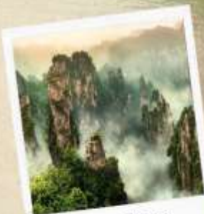
เขาอวตาร