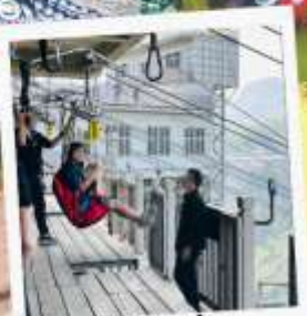
ซิปไลน์ข้าม แกรนด์แคนยอน

รับฟรี!! ประกันสุขภาพ และ อุบัติเหตุ คุ้มครองสูงสุด 2 ล้านบาท