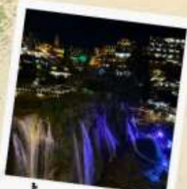
น้ำตกฟูหรงเจิน