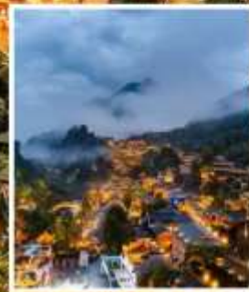
หมู่บ้านเกอต้าวังเซียนกู่