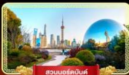
สวนนอร์ดบอนด์