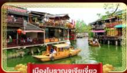
เมืองโบราณจูเจียเจี้ยว

เที่ยวสวนสนุกในฝัน "ดิสนีย์แลนด์" ล่องเรือชมเมืองโบราณจูเจียเจี้ยว