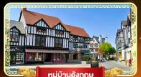
หมู่บ้านอังกฤษ