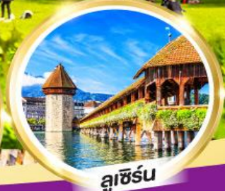
ลูเซิร์น