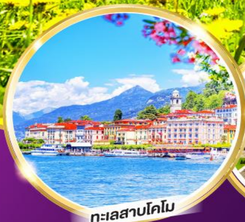
ทะเลสาบโคโม