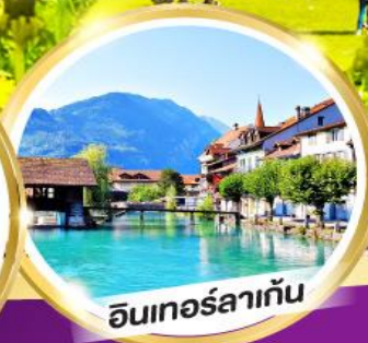
อินเทอร์ลาเก้น