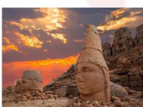
ชมพระอาทิตย์ตกดิน ณ ภูเขาเนมรุต

** พักที่ Euphrat Hotel Nemrut 4* หรือเทียบเท่า **