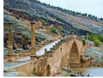
สะพานเซเวอรัน