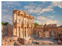
เมืองเอเฟซุส