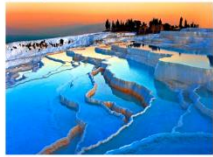
เมืองปามุกคาเล่

** พักที่ Richmond Thermal Hotel 5* หรือเทียบเท่า **