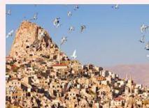
หมู่บ้านของนกพิราบ

** พักที่ Under Cave Hotel 5* หรือเทียบเท่า **