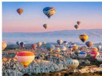
เมืองคัปปาโดเกีย

** พักที่ Under Cave Hotel 5* หรือเทียบเท่า **