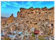
นครใต้ดิน