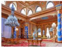
Beylerbeyi Palace ล่องเรือช่องแคบบอสฟอรัส