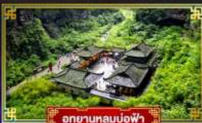
อุทยานหลุมบ่อฟ้า

"ฉงชิ่ง" มหานครสุดอลัง เมืองมรดกโลก อุทยานแห่งชาติหลุมฟ้า 3 สะพานสวรรค์