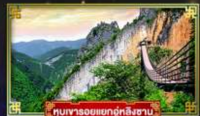
หุบเขารอยแยกถู่ทิงซาบ