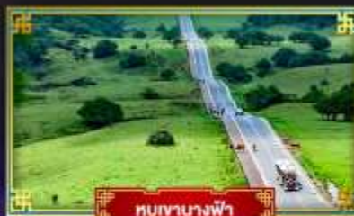
หุบผาทางฟ้า