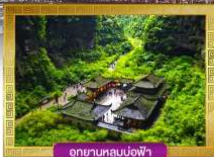
อุทยานหลุมบ่อฟ้า