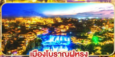
เมืองโบราณฟูหลง