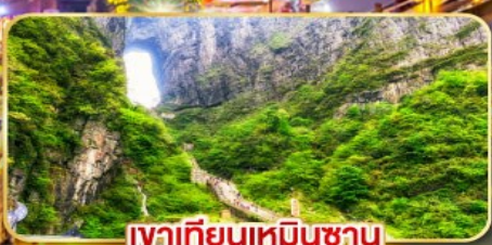
เขากเทียนเหมินซาน