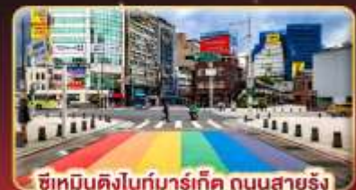
ซีเหมินติงไทม์มาร์เก็ต ถนนสายรุ้ง