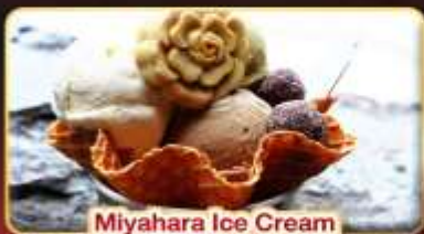
Miyahara Ice Cream