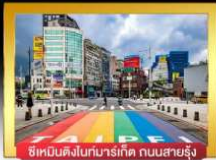
ซีเหมินติงไนท์มาร์เก็ต ถนนสายรุ้ง