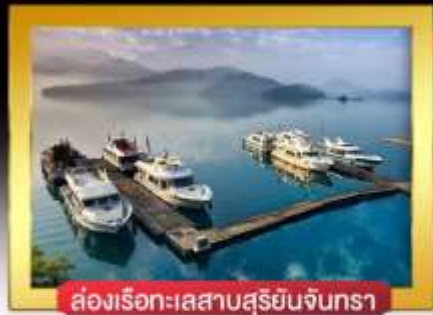
ช่องเรือทะเลสาบสุริยันจันทรา