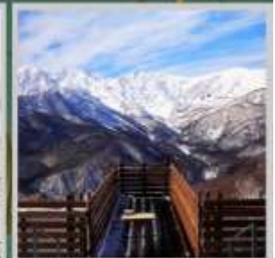
"HAKUBA MOUNTAIN HARBOR"