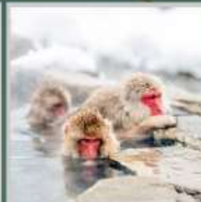
"SNOW MONKEY PARK"