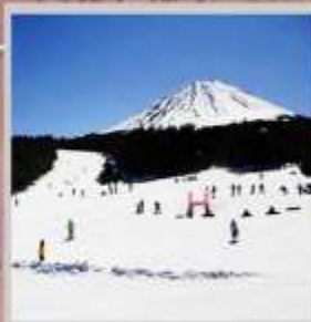
"FUJITEN SNOW PARK"