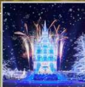
"HUIS TEN BOSCH"