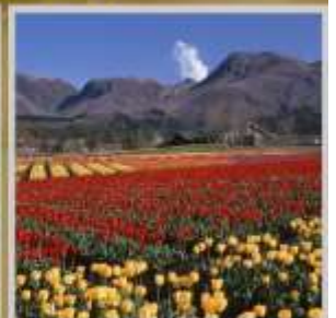
"KUJU HANA PARK"