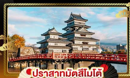
ปราสาทมัตสึโมโต้