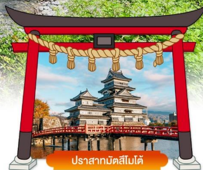
ปราสาทมัตสึโมโต้