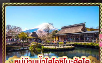
หมู่บ้านน้ำใสโอฮิโนะฮัคโค