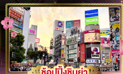
ช้อปปิ้งชิบูย่า