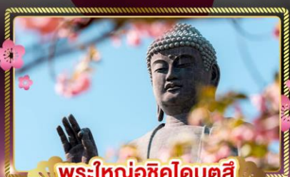
พระใหญ่อุซึคุโดบุคิ