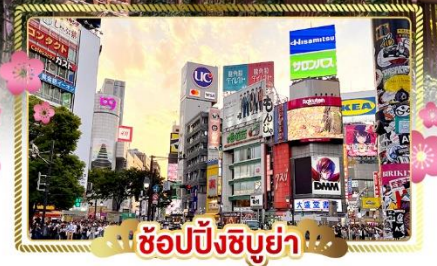
ช้อปปิ้งชิบูย่า