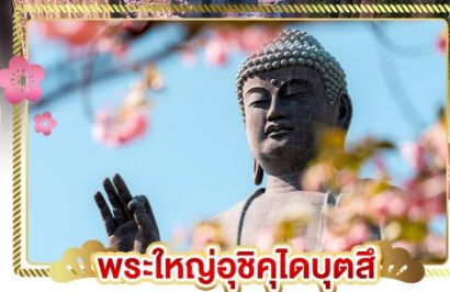
พระใหญ่อุซึคุไดบุตสึ