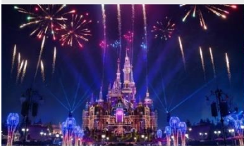
เซียงไฮ้ดิสนีย์แลนด์