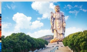
พระใหญ่หลิงชานต้าฝอ