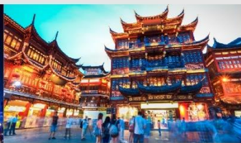
ตลาดร้อยปีเงินหวังเหมียว