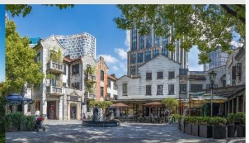
ย่านซินเทียนตี้

*ทางบริษัทฯ ขอสงวนสิทธิ์ในการสลับโปรแกรมทัวร์ตามความเหมาะสมขึ้นอยู่กับสถานการณ์หน้างาน โดยคำนึงถึงผลประโยชน์ของลูกค้าเป็นสำคัญ