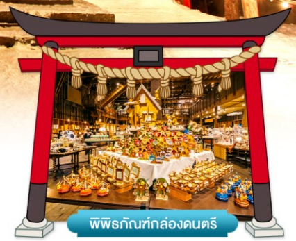
พิพิธภัณฑสถานคลังดนตรี