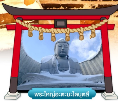
พระใหญ่อะตะมะไดบุตสึ