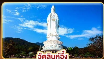
วัดลินห์ฮิ่ง