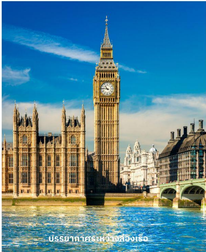
บรรยากาศระหว่างล่องเรือ

จากนั้นผ่านชมสถานที่สำคัญต่างๆ อาทิ บ้านเลขที่ 10, ถนนดาวนิงนี้่ทำเนียบนายกรัฐมนตรี, จัตุรัสทราฟัลการ์, อนุสรณ์แห่งสงครามทราฟัลการ์ของท่านลอร์ดเนลสัน, พิคคาเดิลลี เซอร์คัส, ย่านโซโฮ ฯลฯ