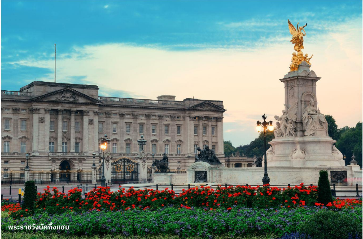
พระราชวังบักกิงแฮม