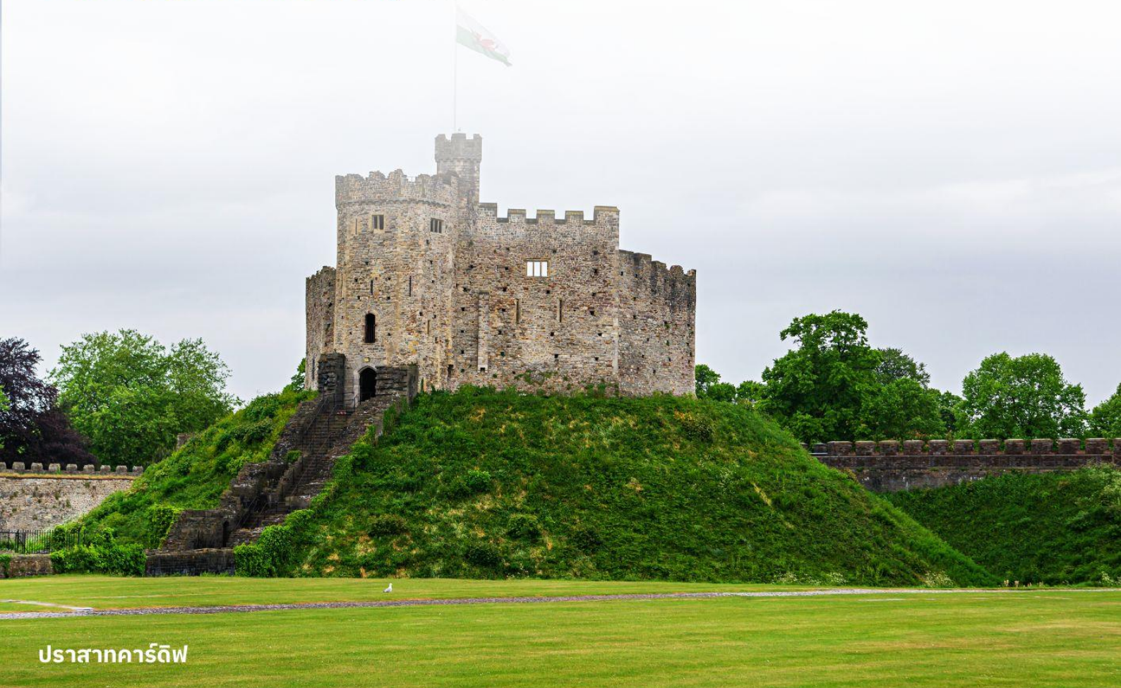
ปราสาทคาร์ดิฟฟ์

บริการอาหารค่ำ ณ ภัตตาคาร นำท่านเข้าสู่ที่พัก Hilton Garden Inn Bristol City หรือเทียบเท่า