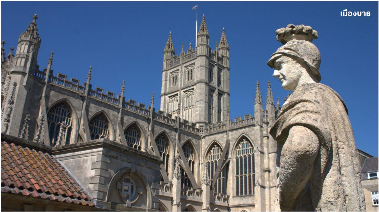
เมืองบาร

หลังจากนั้นนำท่านเดินทางสู่ เมืองบาร ดินแดนแห่งอาณาจักรโรมันอันยิ่งใหญ่บนเกาะอังกฤษเมื่อกว่า 2,000 ปีมาแล้ว ใช้เวลาเดินทางประมาณ 1.30 ชั่วโมง นำท่านเข้าชม โรงอาบน้ำแร่โรมัน ที่ชาวโรมันมาสร้างไว้เป็นสถานที่อาบน้ำแร่โดยอาศัยน้ำจากบ่อน้ำแร่ธรรมชาติที่จะมีน้ำไหลออกมาอย่างต่อเนื่องถึงวันละประมาณ 1,250,000 ลิตร และมีความร้อนถึง 46 องศาเซลเซียส ที่เมืองบารมี บ่อน้ำพุร้อนตามธรรมชาติ 3 แห่ง บ่อนที่ใหญ่ที่สุดคือที่ ROMAN SACRED SPRING น้ำพุจากใต้ดินลึก 3,000 เมตร มีแร่ธาตุถึงกว่า 43 ชนิด