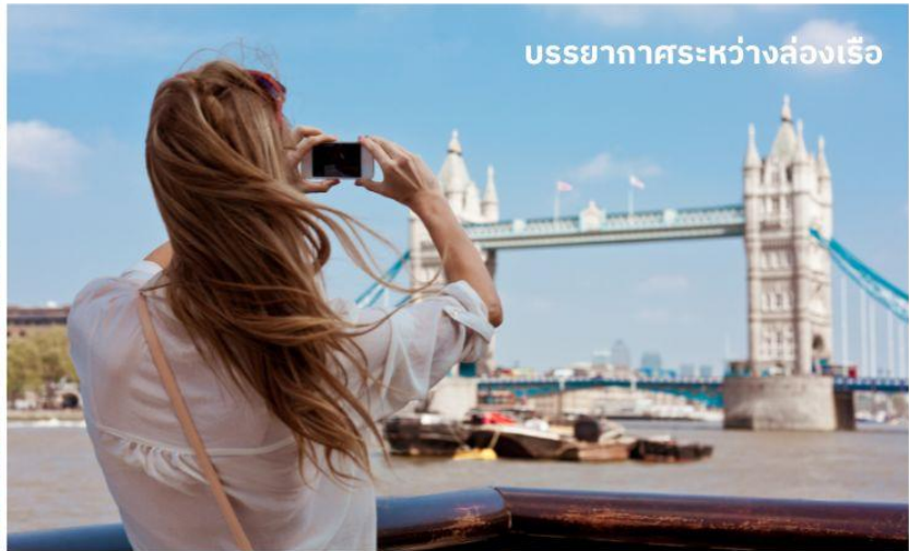
บรรยากาศระหว่างล่องเรือ

ชมทิวทัศน์งดงามของสองฝากฝั่งแม่น้ำเทมส์ ซึ่งไหลผ่านกลางกรุงลอนดอน ล่องเรือผ่านสถานที่สำคัญต่างๆ เช่น จัตุรัสรัฐสภา, พระราชวังเวสต์มินสเตอร์, ลอนดอนอาย, ทาวเวอร์ออฟลอนดอน และ ทาวเวอร์บริดจ์