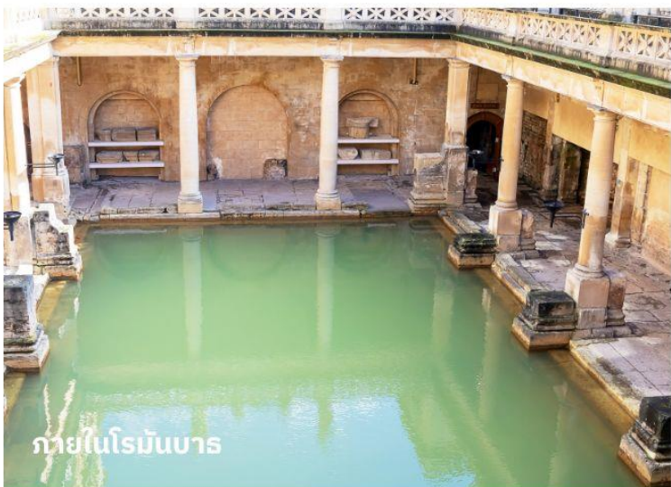
ภายในโรมันบาร