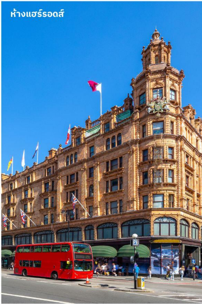
ห้างแฮร์รอดส์