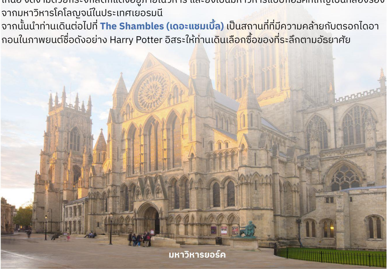
มหาวิหารยอร์ก

จากนั้นนำท่านเดินทางต่อไปที่ The Shambles (เดอะแซมเบิล) เป็นสถานที่ที่มีความคล้ายกับตรอกไดอากอนในภาพยนตร์ชื่อดังอย่าง Harry Potter อีสระให้ท่านเดินเลือกซื้อของที่ระลึกตามอัธยาศัย