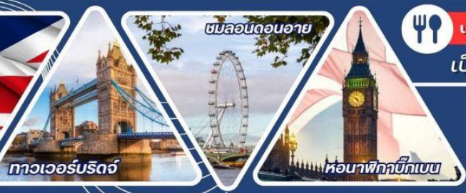
ทาวเวอร์บริดจ์