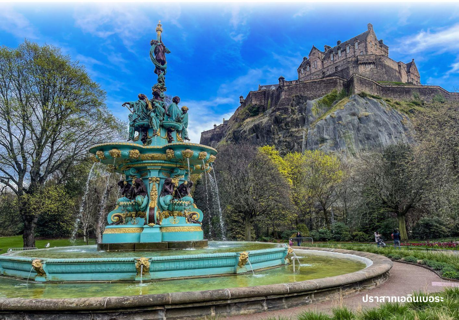
ปราสาทเอ็ดินเบอระ

ผังตรงข้ามเป็นรัฐสภาแห่งชาติสกอตอันน่าทึ่งด้วยสถาปัตยกรรมร่วมสมัย