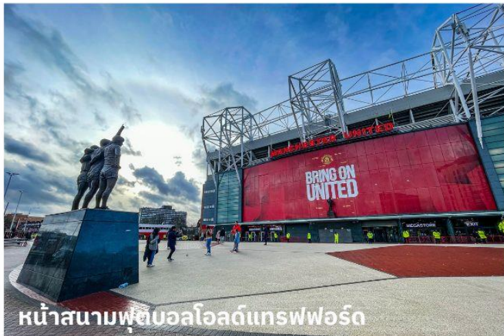
หน้าสนามฟุตบอลโอลด์แทรฟฟอร์ด