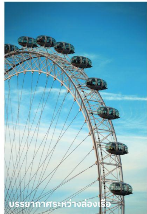
บรรยากาศระหว่างล่องเรือ

ท่านสามารถทำการสแกน QR CODE นี้ เพื่อรับชม “บรรยากาศของ Big Ben” ในรูปแบบวิดีโอ