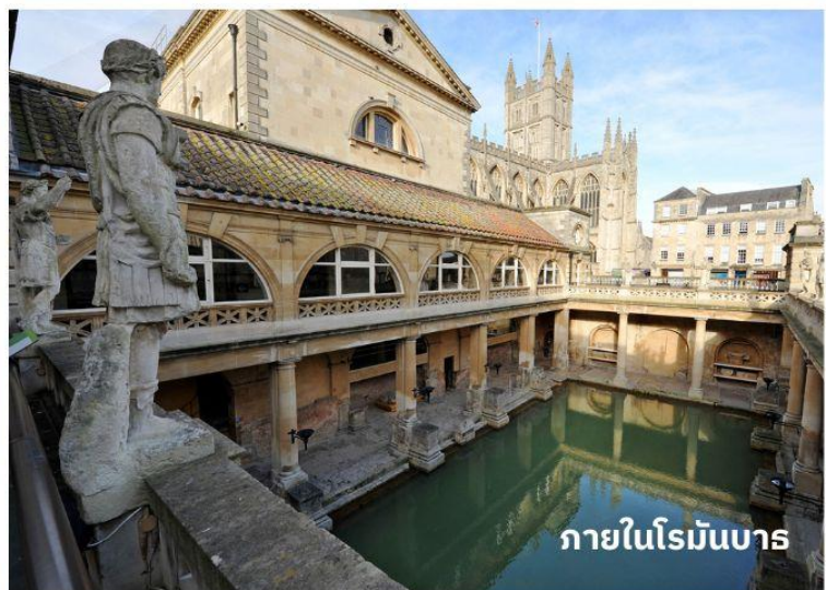
ภายในโรมันบาร