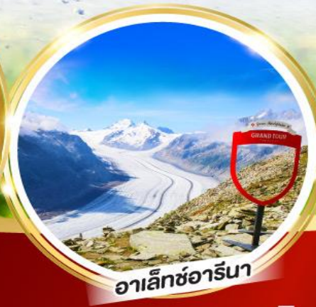
อาเล็ทซ์อาร์นา