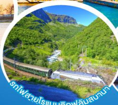
รถไฟสายโรแมนติกฟลัมสบานา