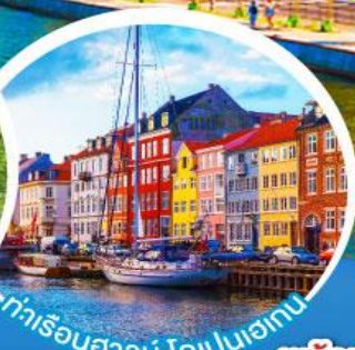
ท่าเรือฮาวัน ไคเปเนอเกน