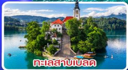
ทะเลสาบเบลด

ไข่มุกแห่งอาเดรียติก พร้อมขึ้นกระเช้า SRD