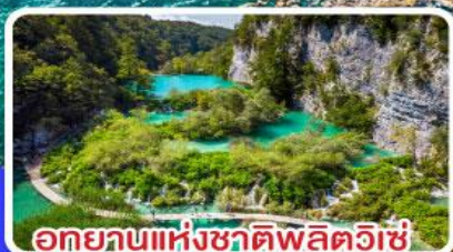
อุทยานแห่งชาติพลิตวิเช่