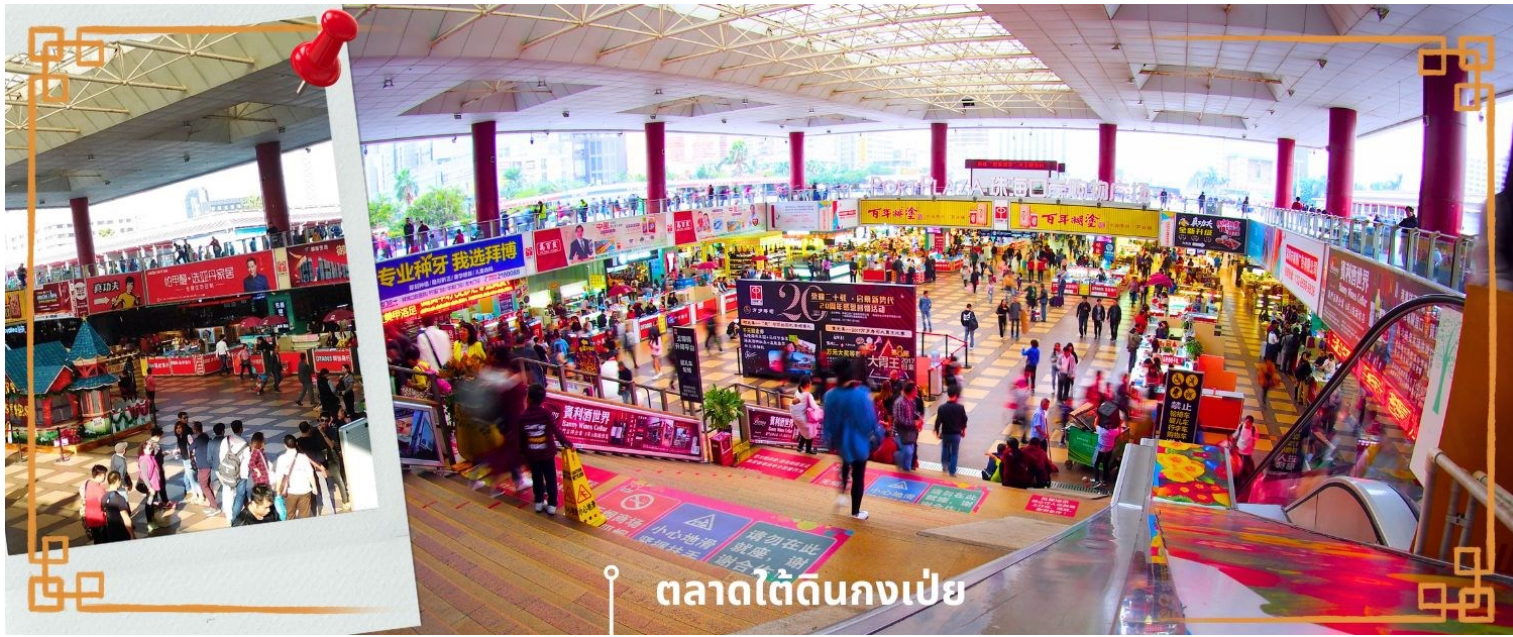
ตลาดใต้ดินกงเป๋ย

จากนั้นนำท่าน อิสระช้อปปิ้งตลาดใต้ดินกงเป๋ย ตั้งอยู่ติดชายแดนมาเก๊า เป็นศูนย์การค้าติดแอร์ ที่มีร้านค้ามากกว่า 5,000 ร้านค้า มีสินค้าให้ท่านเลือกมากมาย เช่น สินค้าก๊อปปี้แบรนด์เนมต่างๆ ไม่ว่าจะเป็นเสื้อผ้า รองเท้า กระเป๋า นาฬิกา ของเด็กเล่น ฯลฯ ที่นี่ มีสินค้าให้เลือกซื้อหลากหลาย จึงเป็นที่นิยมมากของชาวมาเก๊า และฮ่องกง เนื่องจากสินค้าที่นี่มีคุณภาพและราคาถูก