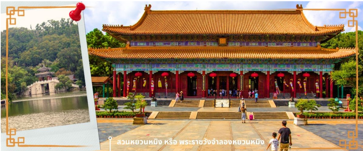
สวนหยวนหมิง หรือ พระราชวังจำลองหยวนหมิง

จากนั้นนำท่านสู่ ร้านหยก หยกในจีนโบราณจนมาถึงสมัยนี้ ยังมีความเชื่อว่าเป็นอัญมณีที่ล้ำค่าและหายาก บ่งบอกฐานะของสตรีในสมัยก่อน แต่ในสมัยนี้ เชื่อกันว่าหยกสีเขียวนั้นเหนียวนำโชคและความร่ำรวย ดังคำกล่าวที่ว่า“สีเขียวเหนียวทรัพย์” ถือเป็น การเสริมดวงจัญที่ดีของผู้สวมใส่อิสระให้ท่านได้เรียนรู้ชนิดของหยกและเลือกซื้อตามใจชอบจากนั้นนำท่านสู่ สวนหยวนหมิง หรือ พระราชวังจำลองหยวนหมิง ตั้งอยู่ ณ ใจกลางหุบเขาซิลิน เมืองฉู่ไห่ สร้างขึ้นเลียนแบบพระราชวังหยวนหมิง ณ กรุงปักกิ่ง สิ่งก่อสร้างต่างๆ มากกว่า 100 ชิ้น มีขนาดเท่าของจริงในอดีตทุกชิ้น อาทิ เสาศิณคู้ สะพานข้ามธารทอง ประตูดำกิง ตำนกเจิ้งต้ากวางหมิง สะพานแก้วเหลี่ยม สวนแห่งนี้โอบล้อมด้วยขุนเขาที่เขียวชอุ่ม และมีพื้นที่ครอบคลุมทะเลสาบขนาดมหึมา ซึ่งมีขนาดเท่ากับสวนเดิมในกรุงปักกิ่ง และยังมีการเพิ่มเติมและตกแต่งสวนที่เป็นศิลปะแบบตะวันตกผสมกับศิลปะจีน