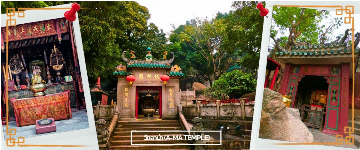
วัดอาม่า (A-MÁ TEMPLE)

จากนั้นนำท่านสู่ วัดอาม่า (A MA TEMPLE) หนึ่งในวัดสำคัญ ศักดิ์สิทธิ์ และเก่าแก่ที่สุดของมาเก๊า คนไทยคุ้นหู ในชื่อ ศาลเจ้าแม่ทับทิม โด่งดังในการขอพรเรื่องหน้าที่การงาน การเงิน และความเป็นสิริมงคลแก่ชีวิต ใครที่ไป กราบไหว้ บูชา กลับมาชีวิตในการทำงาน การเงินก็จะดีขึ้น มีเทพศักดิ์สิทธิ์องค์ต่างๆ ซึ่งผสมผสานความเชื่อทางพุทธ ศาสนา ลัทธิเต๋า คติความเชื่อพื้นบ้าน วัฒนธรรมประเพณี และความศรัทธา โดยตัววัดมีความเก่าแก่อย่างมาก ทำให้มีคุณค่าทางประวัติศาสตร์ จึงทำให้วัดแห่งนี้ กลายเป็นหนึ่งในสถานที่ ที่กำหนดไว้ในศูนย์ประวัติศาสตร์แห่ง มาเก๊า แต่เดิมเชื่อกันว่าที่มาของชื่อ มาเก๊า มาจากบริเวณวัดอาม่าแห่งนี้นี่เอง โดยในอดีตจะมีอ่าวที่ชื่อว่า อาม่า ก๊อ ก แปลว่า อ่าวของอาม่า จึงเพี้ยนมาเป็นชื่อ มาเก๊า ในปัจจุบันนั่นเอง ต่อมาในปี 2005 วัดอาม่า มาเก๊า ได้รับการขึ้นทะเบียนให้เป็นมรดกโลกโดย UNESCO ซึ่งตัววัดเองมีตำนานเล่าว่า มีเด็กสาวชื่อว่า หลินโม ซึ่งเป็นเด็กที่ เฉลียวฉลาด สามารถหยั่งรู้ถึงความเจ็บไข้ได้ป่วยของผู้อื่น อยู่มาวันหนึ่ง หลินโม มีความคิดอยากจะข้ามมายัง คาบสมุทรอ่าวเหมิน จึงขอติดเรือไปกับคนอื่นที่อยากจะข้ามฝั่งด้วยเช่นกัน แต่มีเหตุการณ์ไม่คาดคิด เกิดพายุโหม กระหน่ำ ทำให้เรือหลายลำที่เดินทางไปด้วย กันจมลงสู่ใต้ท้องทะเล ยกเว้นเรือที่มีหลินโม จนทำให้สามารถที่