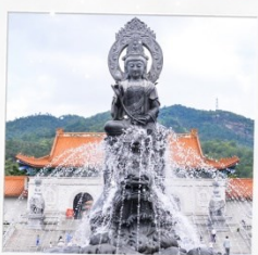
วัดพุทโธ