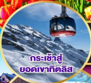
กระเช้าสู่ยอดเขาทิคิลิส

19-28 มี.ค.68 / 01-10, 12-21, 14-23 เม.ย.68 03-12, 04-13, 05-14 พ.ค.68