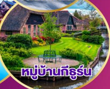
หมู่บ้านทึร์รูน