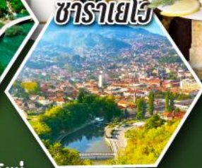
ซาราเยโว