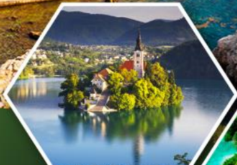
ทะเลสาบเบลด