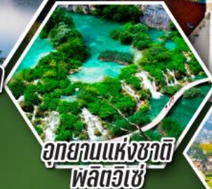
อุทยานแห่งชาติ พลตวิเซ