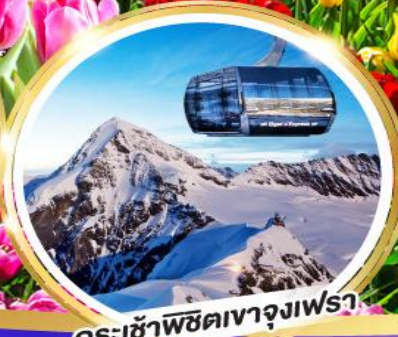
กระเช้าพิชิตเขาจุงเฟรา