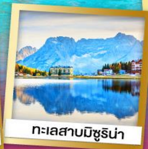
ทะเลสาบมิซูรีน่า