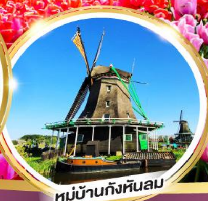
หมู่บ้านกังหันลม