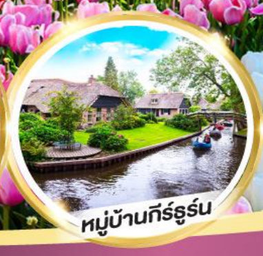
หมู่บ้านกัร์ธูร์น