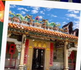
วัดปักไต้