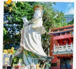
เจ้าแม่กวนอิมรพัสลามย์

23 กุมภาพันธ์ 2568 วันเยี่ยมเงินเจ้าแม่กวนอิม วัดฮ่องฮ่า