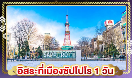
อิสระที่เมืองซัปโปโร 1 วัน