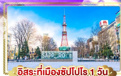
อิสระที่เมืองซัปโปโร 1 วัน