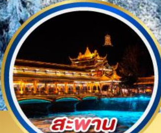
สะพาน หนานเจียว