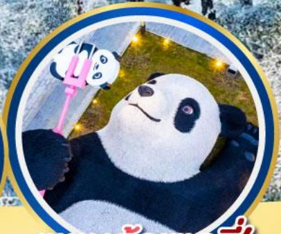
แพนด้าชลพี