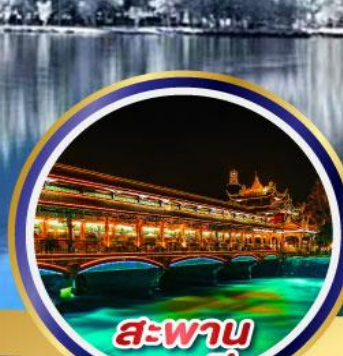
สะพาน หนานเจียว