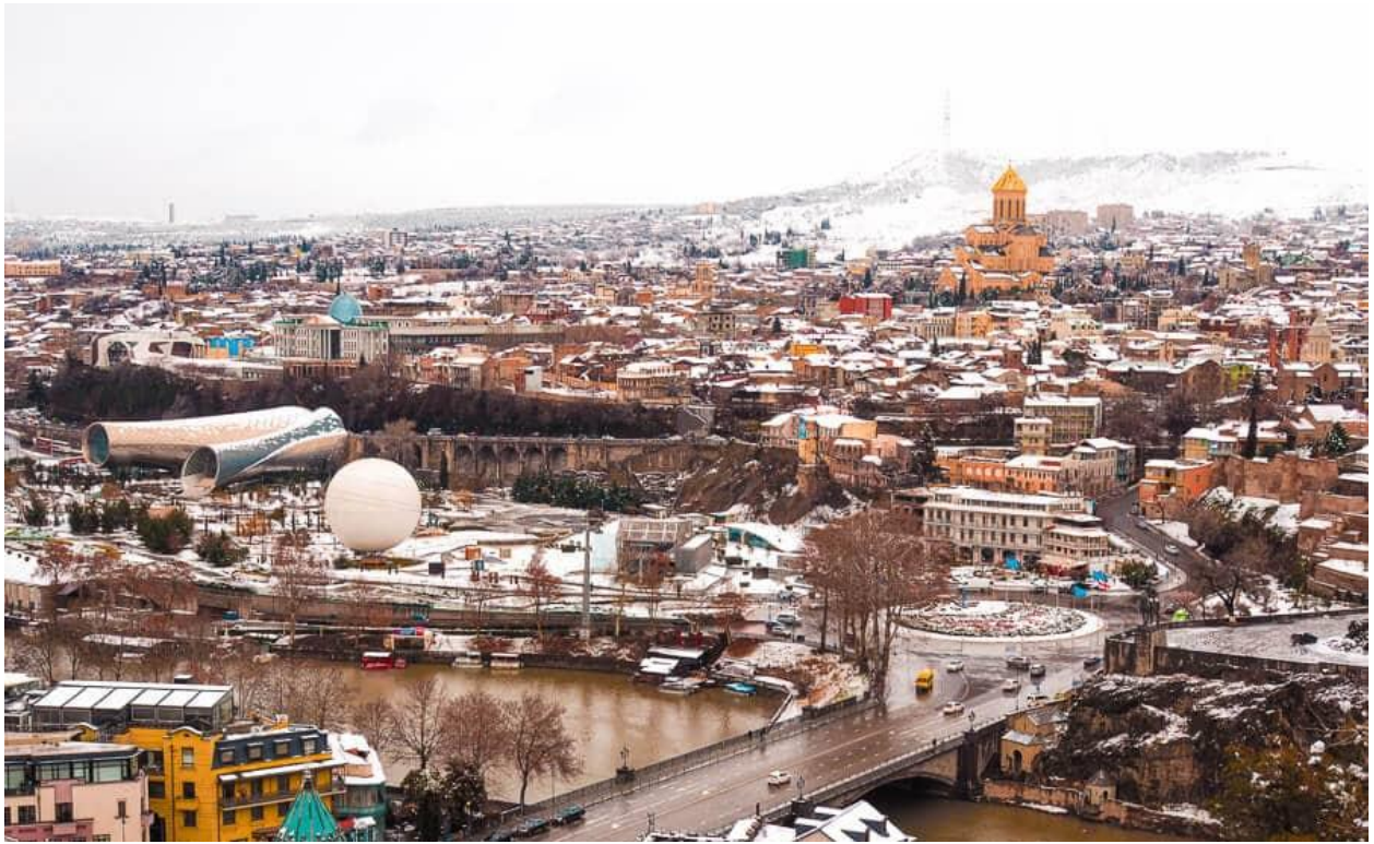
จากนั้นนำทุกท่านถ่ายรูปที่สะพานสันติภาพ Bridge of Peace